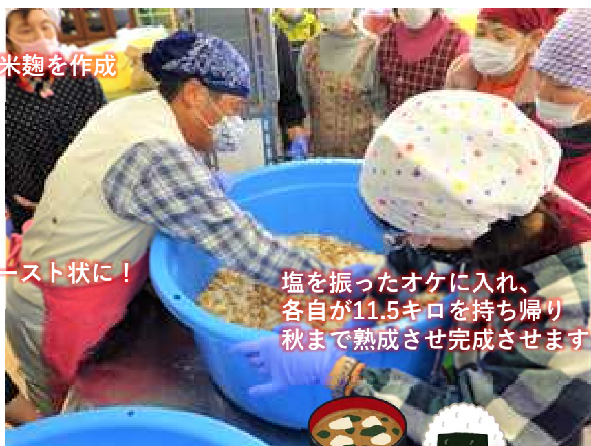
塩を振ったオケに入れ、 各自が11.5キロを持ち帰り 秋まで熟成させ完成させます