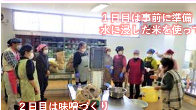
1日目は事前に準備 水に浸した米を使って米麴を作成

参加者は「自分で仕込むようになってから、みそ汁が好きになった。出来上がる秋が楽しみ」と話してくれました。