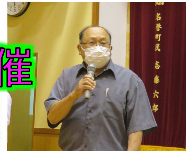
↑会長からのご挨拶